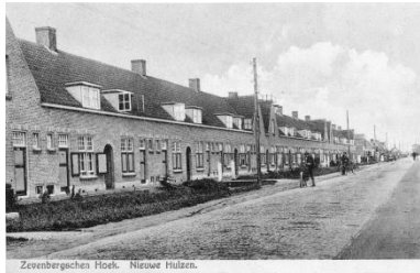
Zevenbergsche Hoek. Nieuwe Holland.

De straat had zijn naam waarschijnlijk te danken aan de vele bruggetjes die aan weerskanten van de straat over de brede sloten lagen.