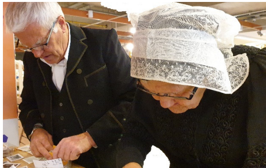
Ruildag bij Jumbo