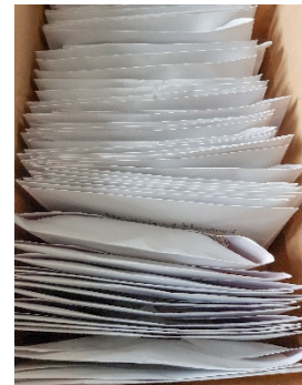
Enveloppen met bestellingen

Bijna alle bestellingen zijn inmiddels uitgeleverd en de actie loopt dus nu ook voor ons af. Er zijn nog plaatjes over, dus als iemand nog een plaatje mist dan kan hij/zij dat komen halen. De kosten bedragen € 0,10 per plaatje.