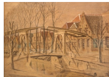
Noordhaven met de Tweede brug in de 19de

Ga naar deze link voor een filmpje over Joannes Brabers https://youtu.be/YwPc1kcVb_E