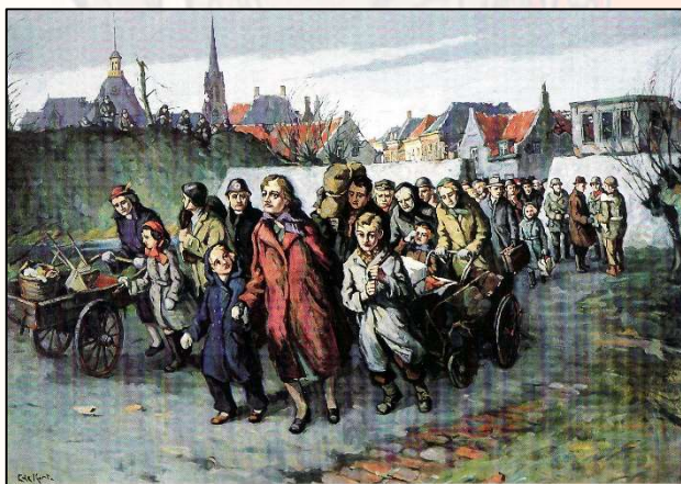
De Willemstadse bevolking mag vertrekken naar veiliger oorden

Op 30 november 2024 rijden we met de bus door de gemeente en medewerkers van de Heemkundekringen vertellen u wat er op de verschillende plaatsen die we aandoen is gebeurd bij de bevrijding en in de daaraan voorafgaande bezetting. Maar ook deelnemers kunnen iets van hun herinneringen of die van hun ouders delen met de medereizigers. Meldt dat even bij uw aanmelding, dan laten we u onderweg ook even aan het woord. Bovendien laten we onderweg natuurlijk foto's zien van de dorpen waar we doorheen rijden