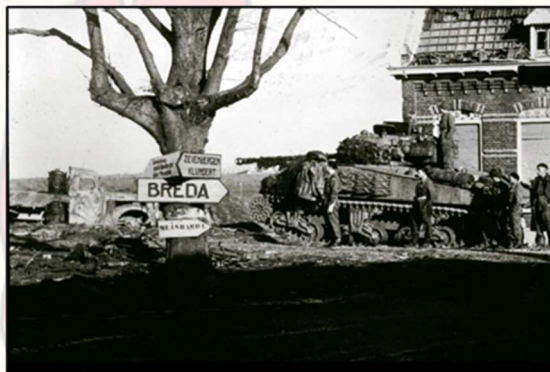
Polen bevrijden Moerdijk

Begin november 2024 is het 80 jaar geleden dat de gemeente Moerdijk werd bevrijd. Dat gaan we met z'n allen herdenken. Behalve dat de Heemkundekringen van Moerdijk ieder hun eigen activiteiten organiseren hebben we ook dit jaar weer iets gezamenlijks gepland, namelijk de bevrijdingsbus. Niet helemaal nieuw natuurlijk, want 5 jaar geleden deden we dat ook al eens, maar er zijn natuurlijk mensen die toen niet mee konden, er niet van gehoord hadden, nieuw zijn in de gemeente of gewoon nog eens mee willen.