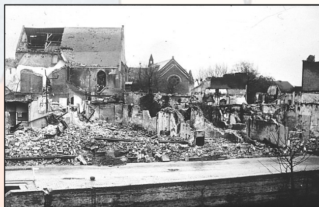
De twee kerken van Zevenbergen, of wat er na de bevrijding van over was.