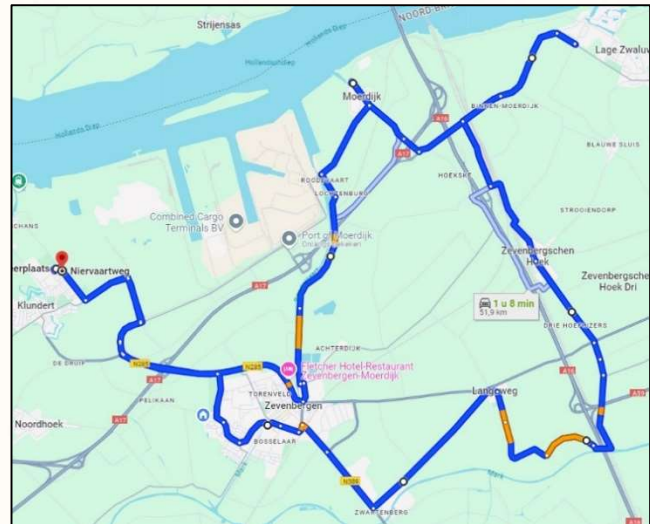
De Oostelijke route